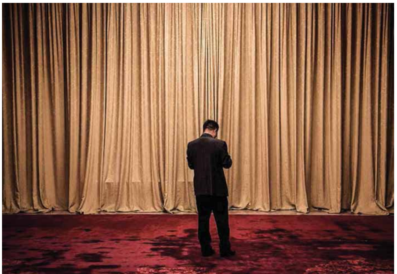
Ένας συμμετέχων κοιτάζει το κινητό του τηλέφωνο στο 19ο συνέδριο του Κινεζικού Κομμουνιστικού Κόμματος στο Πεκίνο στις 19 Οκτωβρίου 2017.

Η αναφορά της USCC αμφισβάζει για την ικανότητα κερδοφορίας μερικών από τα κινεζικά πρότζεκτ, όπως ο Τερματικός Σταθμός Πλεύσης Αμάντο, των $167 εκατομμυρίων, ο οποίος «δεν βρίσκεται κοντά σε καμία σημαντική διαδρομή πλοίων».