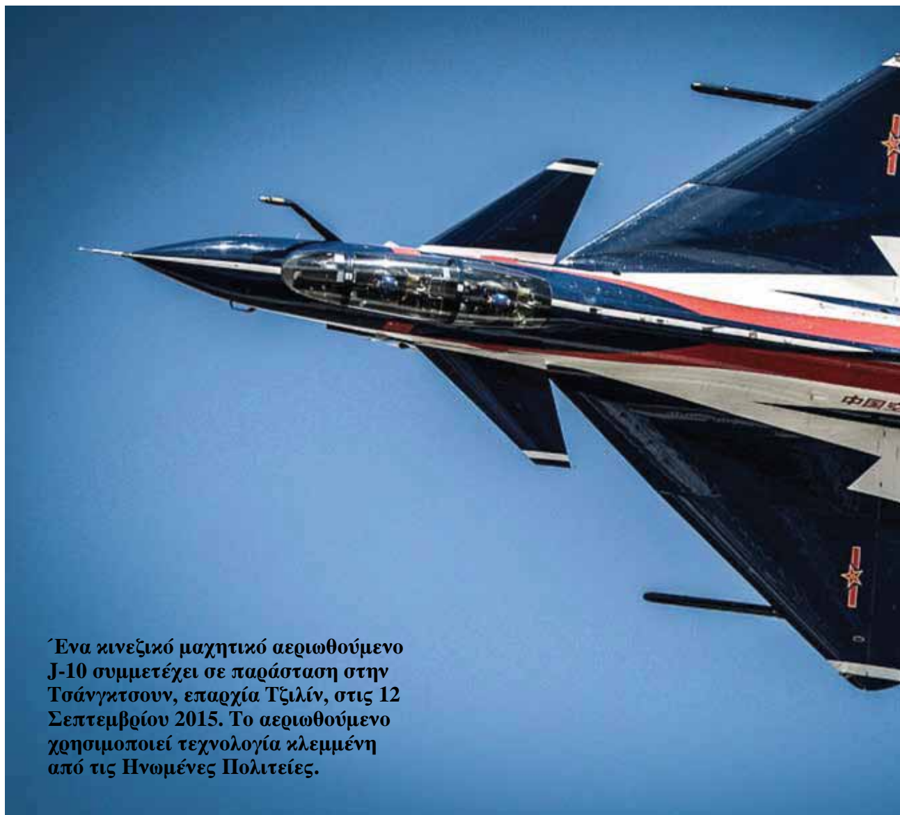
Ένα κινεζικό μαχητικό αεριωθούμενο J-10 συμμετέχει σε παράσταση στην Τσάνγκτσουν, επαρχία Τζιλίν, στις 12 Σεπτεμβρίου 2015. Το αεριωθούμενο χρησιμοποιεί τεχνολογία κλεμμένη από τις Ηνωμένες Πολιτείες.

Το Πεντάγωνο υπέγραψε συμβόλαιο [μετά την διαδικασία επιλογής] με μια