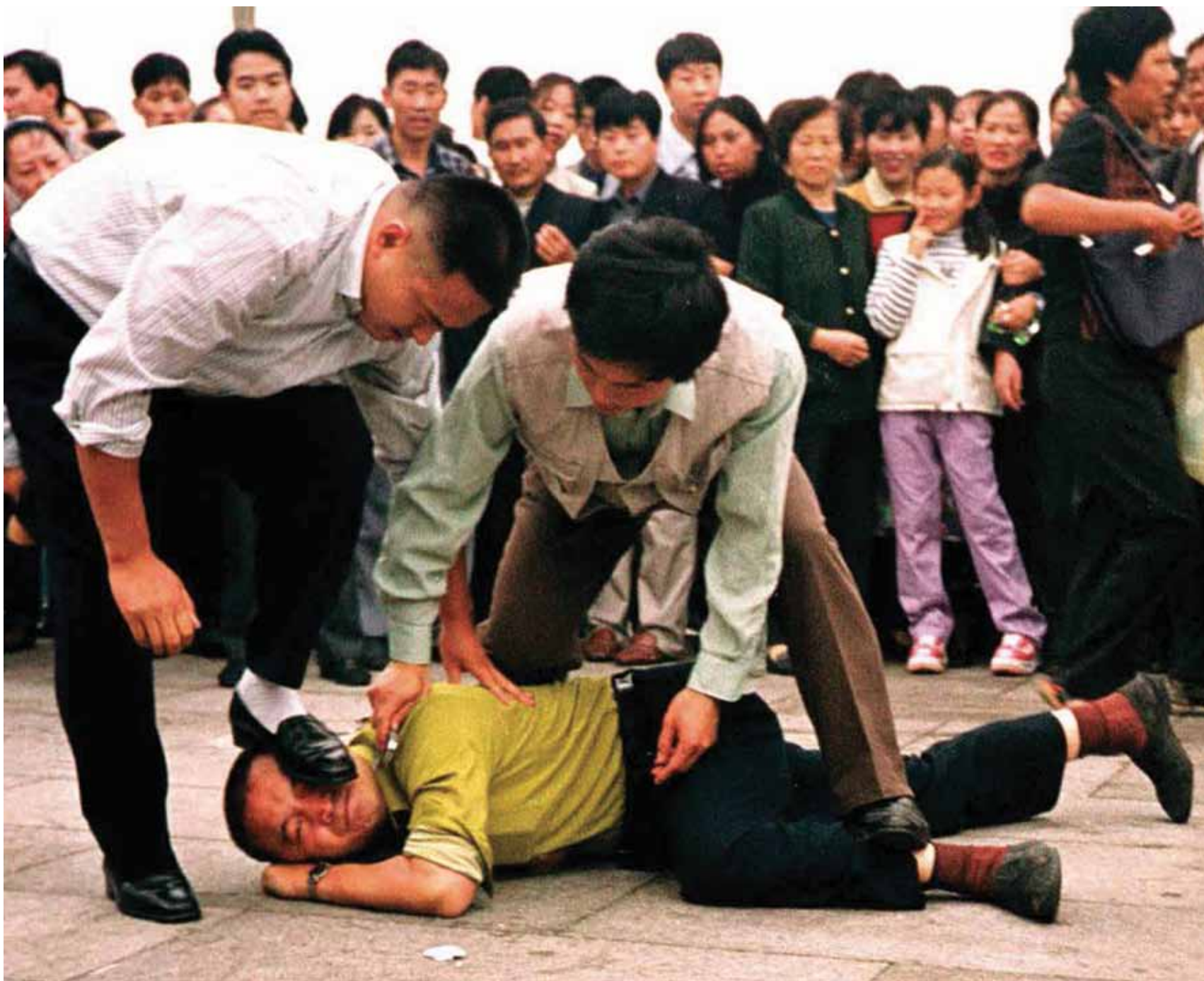
Αστυνομικές αρχές συλλαμβάνουν έναν ασκούμενο του Φάλουν Γκονγκ στην πλατεία Τιενανμέν την 1η Οκτωβρίου 2000.

Η Huawei ακολουθεί τη γραμμή του κόμματος πολύ στενά σε διάφορα θέματα, ένα εκ των οποίων είναι η δίωξη του Φάλουν Γκονγκ, μια ειρηνική πνευματική και διαλογιστική εξάσκηση, βασισμένη στις αρχές της αλήθειας, καλοσύνης, ανεκτικότητας.