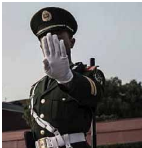
Ένας παραστρατιωτικός αστυνομικός κοντά στην πλατεία Τιενανμέν στο Πεκίνο, στις 22 Οκτωβρίου 2017.

«Η Huawei, για παράδειγμα, έχει προωθήσει την ιδέα της 'έξυπνης πόλης' σε ολόκληρο τον κόσμο». Ο Νι χαρακτήρισε την ιδέα ως εργαλείο «διευκόλυνσης της οργάνωσης μιας πόλης και διαχείρισης ζωτικών υπηρεσιών όπως της μαζικής συγκοινωνίας και της ασφάλειας».