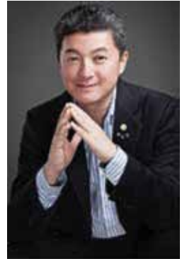
Ο φυσικός και επιχειρηματίας επενδυτής Τζανγκ Σουτσένγκ.

Ο Τζανγκ έχει λάβει πολυάριθμα διεθνή βραβεία από το 2007 για τις επιτυχίες του.