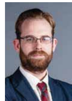
Τζάσπερ Φάκερτ Αρχισυντάκτης

Η Huawei επίσης διαδραματίζει έναν πολύ βασικό ρόλο στα προγράμματα μαζικής παρακολούθησης του Κινεζικού Κομμουνιστικού Καθεστώτος, τις παραβιάσεις των ανθρωπίνων δικαιωμάτων, και την προσπάθεια για τεχνολογική κυριαρχία. Αυτό αποτελεί θεμελιώδες στοιχείο για να κατανοήσουμε την φύση των επιχειρηματικών λειτουργιών και της κατεύθυνσης της εταιρείας - όλα τα οποία θα εξηγήσουμε σε αυτήν την ειδική έκδοση.