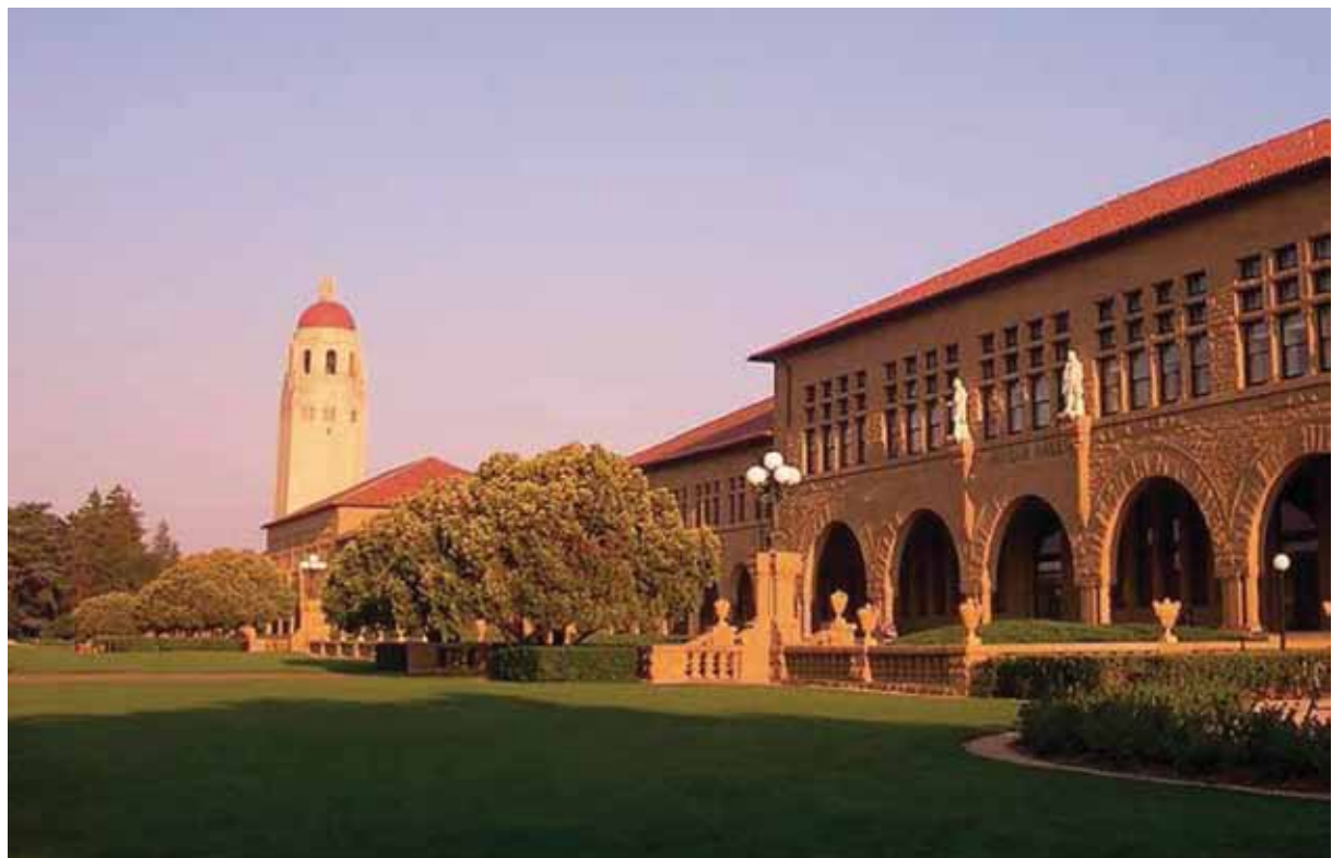
Η πανεπιστημιούπολη του Πανεπιστημίου Στάνφορντ. Ο Τζανγκ Σοουτσένγκ έχαιρε εκτίμησης ως ερευνητής φυσικής και διδάσκων του πανεπιστημίου.

Κάτι που εντείνει τις υποθέσεις, είναι ότι μετά τον θάνατο του Τζανγκ, όλα τα [διαδικτυακά] άρθρα σχετικά με τις σχέσεις του με κινεζικές οργανώσεις και εξέχοντα άτομα, διεγράφησαν, καθώς το κινεζικό διαδίκτυο ελέγχεται και επιβάλλεται κρατική λογοκρισία.