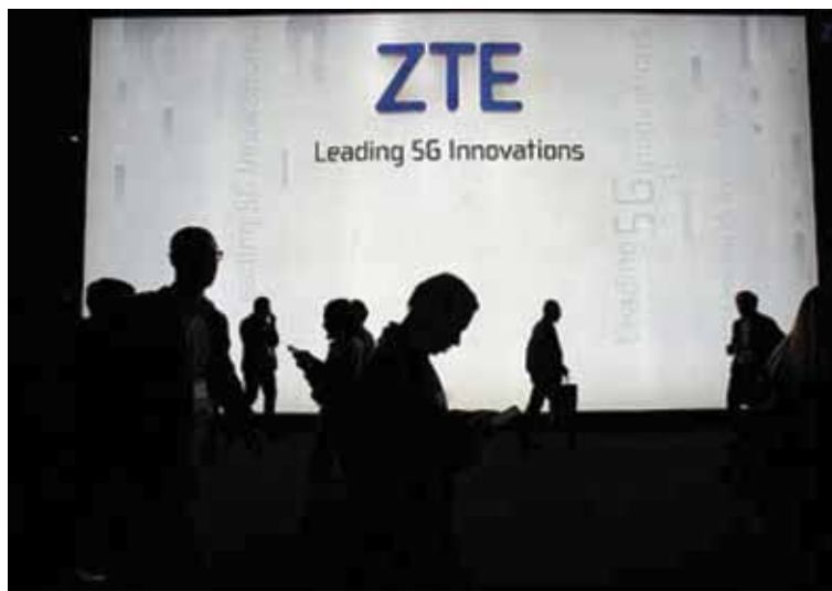
Ο πάγκος της ZTE κατά τη διάρκεια του Παγκόσμιου Συνεδρίου Κινητής Τηλεφωνίας στην Βαρκελώνη, Ισπανία, στις 27 Φεβρουαρίου 2018.

να διερευνήσουν νομικά την Μενγκ, την κόρη του ιδρυτή της Huawei, σχετικά με την παραβίαση των κυρώσεων προς το Ιράν.