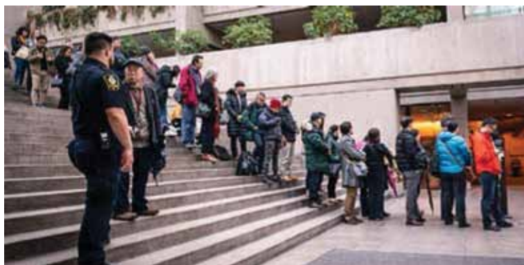
Ένα πλήθος περιμένει στην ουρά για να μπει στην αίθουσα του δικαστηρίου για να παρακολουθήσει την ακρόαση για εγγύηση της CFO της Huawei Μενγκ Γουαντζόου στο Βανκούβερ του Καναδά στις 10 Δεκεμβρίου 2018.