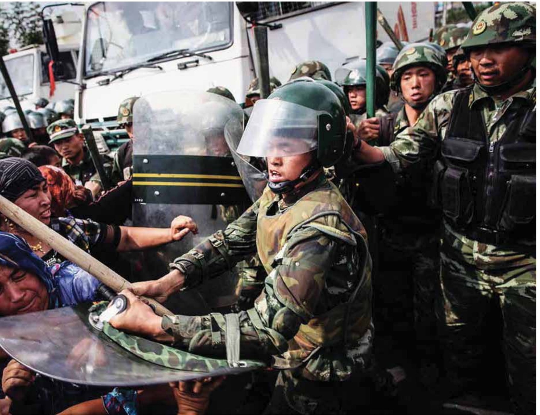
Κινέζοι αστυνομικοί σπρώχνουν Ουιγούρους που διαμαρτύρονται σε ένα δρόμο στο Ουρούμτσι, επαρχία Σιντζιάνγκ, Κίνα, 7 Ιουλίου 2009.