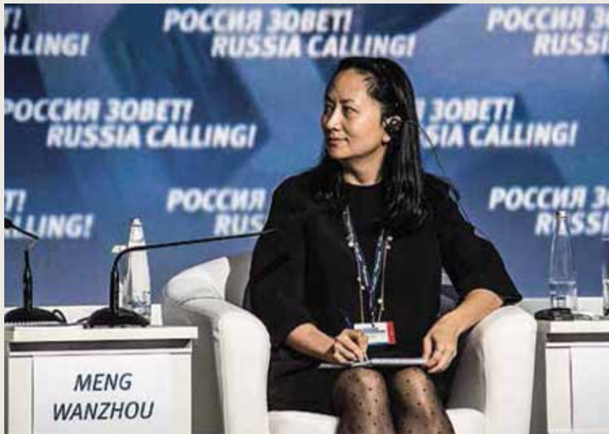
Η Μενγκ Γουαντζόου, CFO του κινεζικού κολοσσού τεχνολογίας Huawei, σε ένα Φόρουμ Επενδύσεων Κεφαλαίου VTB στη Μόσχα στις 2 Οκτωβρίου 2014.

Η Μενγκ, 46 ετών, είναι το μεγαλύτερο παιδί του ιδρυτή της Huawei Ρεν Τζενγκφεί και πολλοί πίστευαν ότι θα ήταν η διάδοχος της ηγεσίας στην σχετιζόμενη με τον στρατό εταιρεία. Άφησε το λύκειο και βρήκε δουλειά σε μια τράπεζα στην νότια μητρόπολη της Κίνας, Σεντζέν. Έγινε μέλος της Huawei το 1993 και πήρε τον