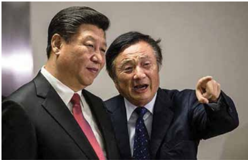
(Πάνω) Ο πρόεδρος της Huawei Ρεν Τζενγκφεί (Δ) ξεναγεί τον Κινέζο επικεφαλής Σι Τζινπίνγκ στα γραφεία της εταιρείας στο Λονδίνο στις 21 Οκτωβρίου 2015.